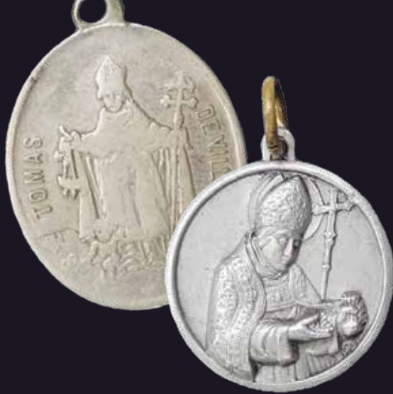
Arriba, medallas devocionales. Villanueva de los Infantes, izquierda 1883, derecha 1955. Colección particular.